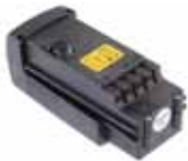
BATTERY Li-Po 14.8V - 3.2Ah