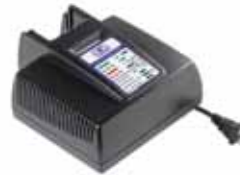
CHARGER for Battery Li-Po 14.8V - 2Ah Li-Po 14.8V - 3.2Ah

CHARGER Battery Li-Po 14.8V - 2Ah Battery Li-Po 14.8V - 3.2Ah