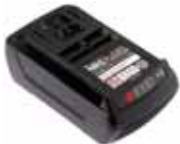
BATTERY Li-Ion 36V - 2.5Ah