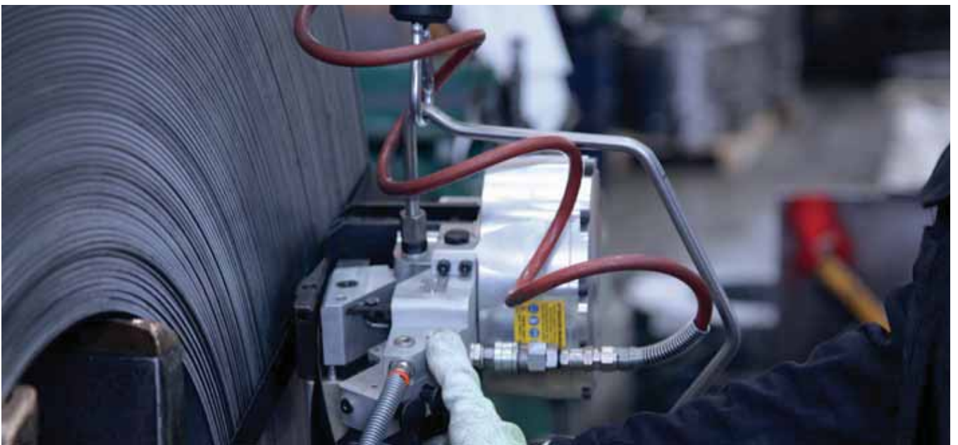
PLASTIC & STEEL STRAPPING TOOLS