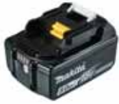
BATTERY Li-Ion 18V - 5Ah