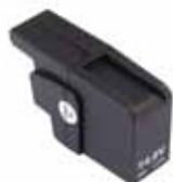
BATTERY Li-Po 14.8V - 3Ah