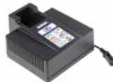
CHARGER for Battery Li-Po 14.8V - 2Ah Li-Po 14.8V - 3Ah

CHARGER Battery Li-Po 14.8V - 2Ah Battery Li-Po 14.8V - 3Ah