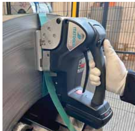
PLASTIC & STEEL STRAPPING TOOLS