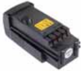
BATTERY Li-Po 14.8V - 2Ah

ITA20M/ITA21M/ITA22/ITA28/ITA29/ITA71/ITA84/ITA85