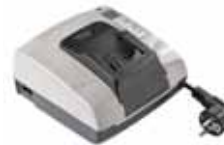
CHARGER for Battery Li-Ion 36V - 2.5Ah