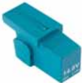
BATTERY Li-Po 14.8V - 2Ah