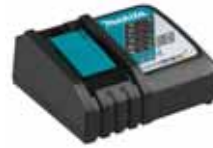
CHARGER for Battery Li-Ion 18V - 5Ah

ITA20M/ITA21M/ITA22/ITA28/ITA29/ITA71/ITA84/ITA85